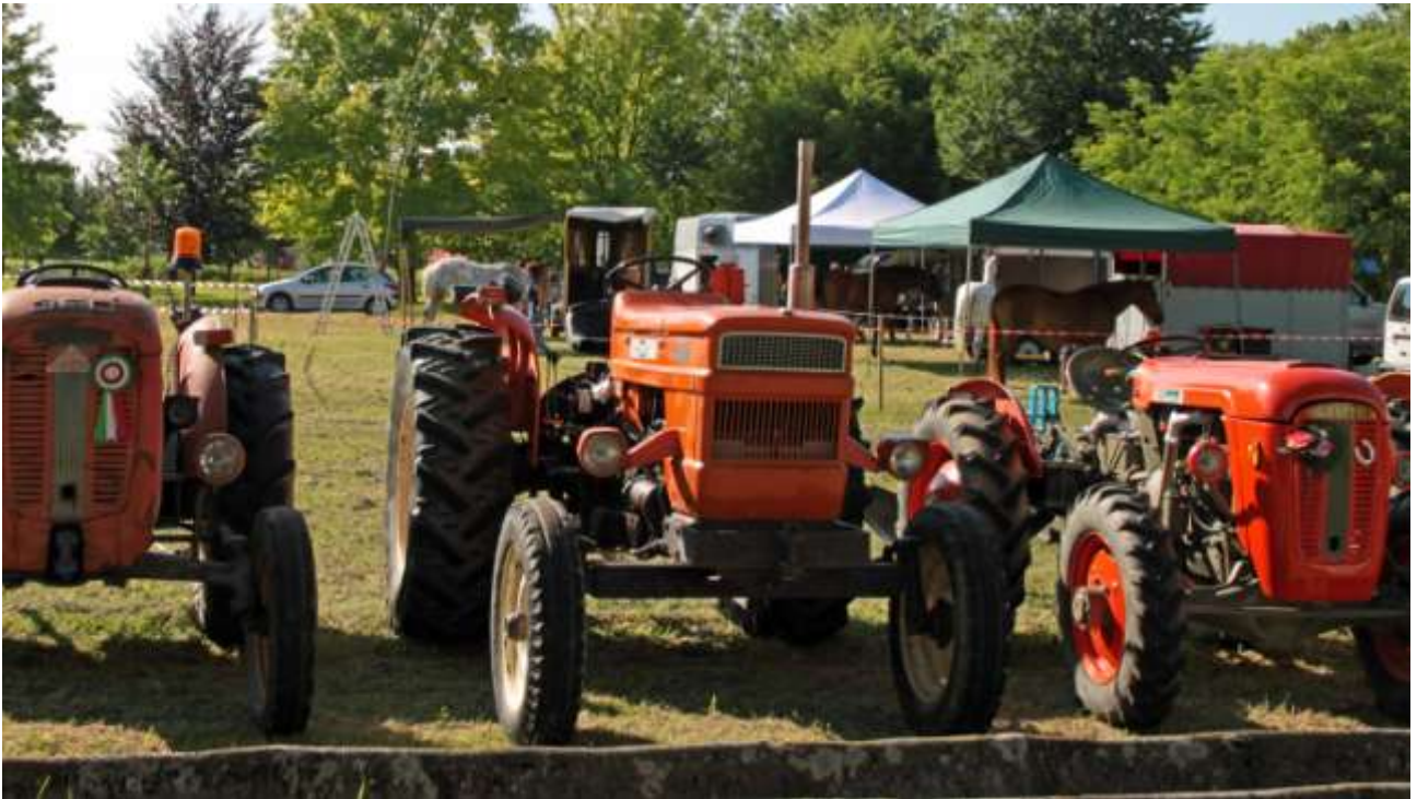
Il trattore : "arma" vincente nel mondo rurale.