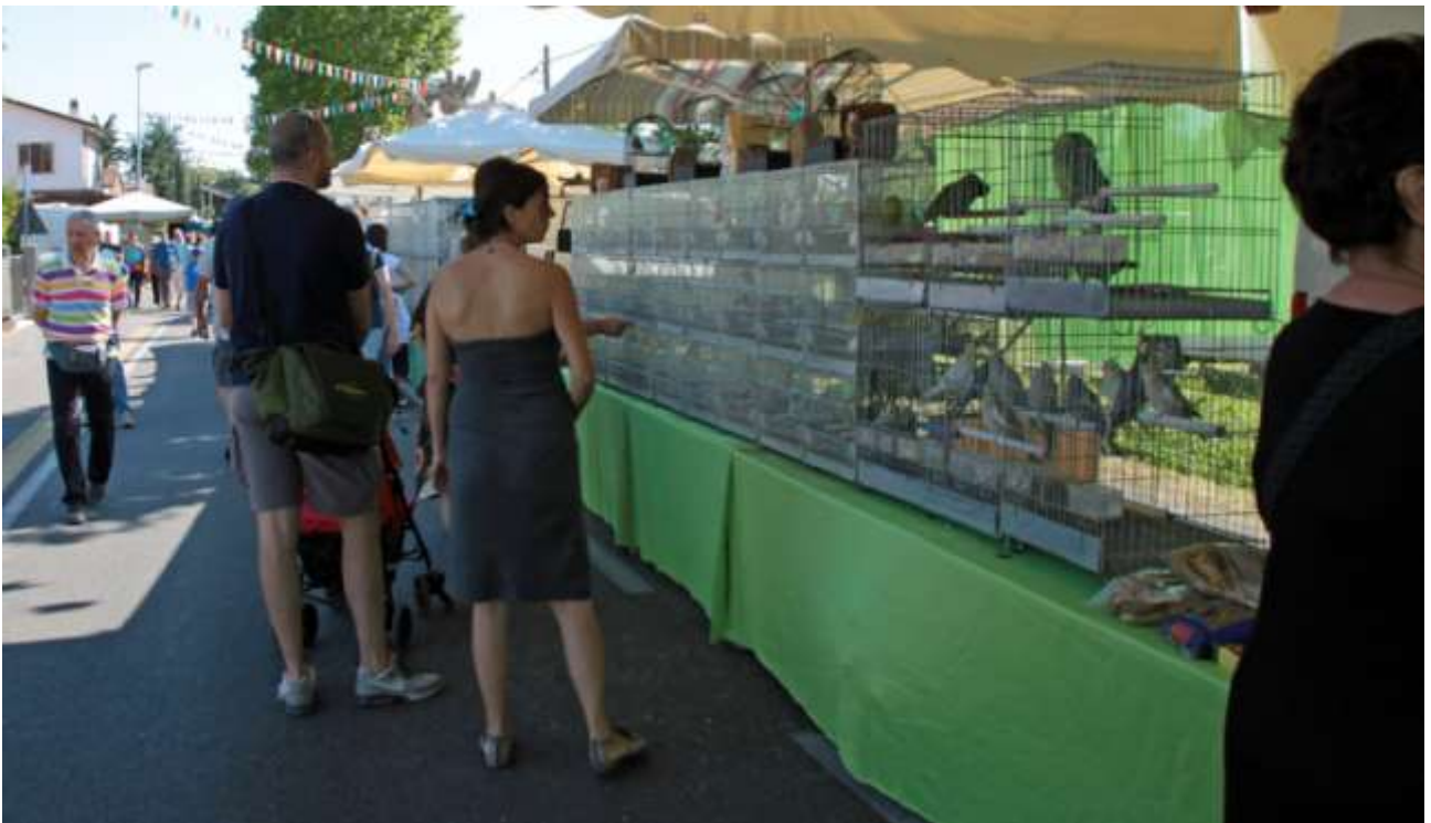
CENTRO FAUNA di BATTAGELLO NATALINO e FANTIN NORMA con il loro gruppo esotici.